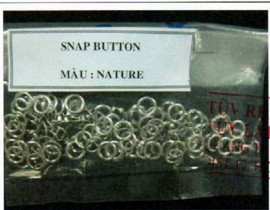
Pic. 12: Color: NATURE