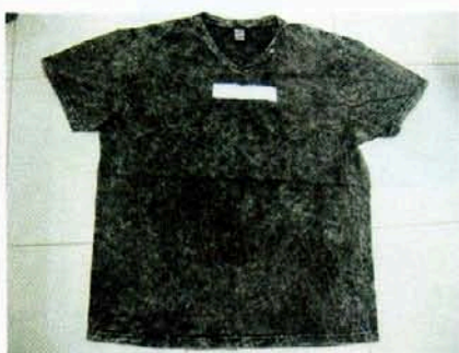
Pic. 1: COLOR: BLACK

TÜV RHEINLAND GROUP TÜV LABORATORIES QUANG TRUNG SOFTWARE CITY DIST. 12. HCM CITY