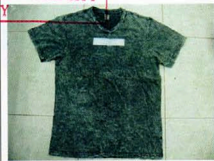
Pic. 3: COLOR: INDIGO