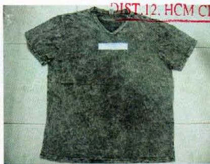
Pic. 2: COLOR: CHARCOAL