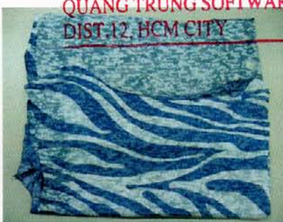
Pic. 2: Color: PURPLE