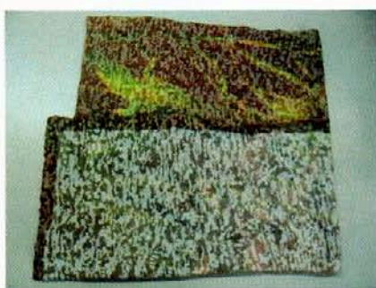
Pic. 1: Color: MULTI COLORS

TÜV RHEINLAND GROUP TÜV LABORATORIES QUANG TRUNG SOFTWARE CITY DIST.12, HCM CITY